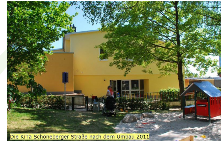
Die KiTa Schöneberger Straße nach dem Umbau 2011!

„Der Verbund bündelt eine große Vielfalt an Qualifizierungsmöglichkeiten, Infos zu Vereinbarkeit von Familie und Beruf und dem Know-how der einzelnen Betriebe ein außerordentliches Netzwerk.“